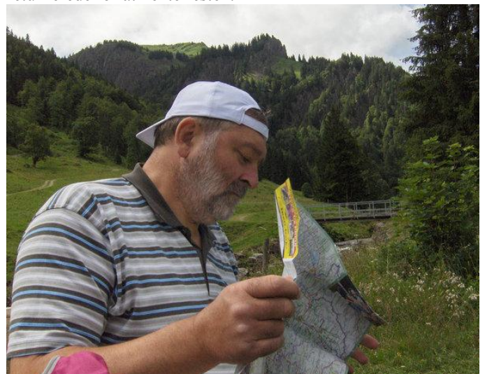
Hvor hulen er vi?!?!?!?

Vi regnede sådan set med der var et skilt til Ostertaltobel, men fandt ikke andet end indgangen til et naturområde. Så var den nok inde i reservatet. Folk blev sat af og bussen returnerede for at hente resten.