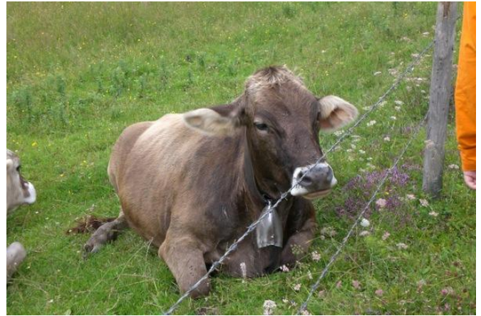
Nej, det er ikke denne ko der er ved at kælve.

Vi snakkede med nogle andre om Ostertaltobel og fik at vide den var uden for reservatet, så sydfrugterne blev pakket og tilbage igen. På vejen tilbage blev livets cirkel sluttet igen, da nogle så en ko der var ved at kælve.