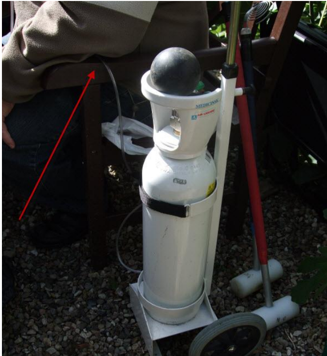
Andre havde selv fustage med og indtog forfriskningerne ultra-nervøst (eller hvad det nu hedder)

De 3 runder udgjorde slagspillet, og den suveræne vinder blev Lene H. med 93 slag. Nr. 2 blev Otto Olsen med 98 slag, og endnu engang måtte Søren C nøjes med en 3. plads med 100 slag. En trøst var at han var foran faderen der også havde 100 slag på 4. pladsen.