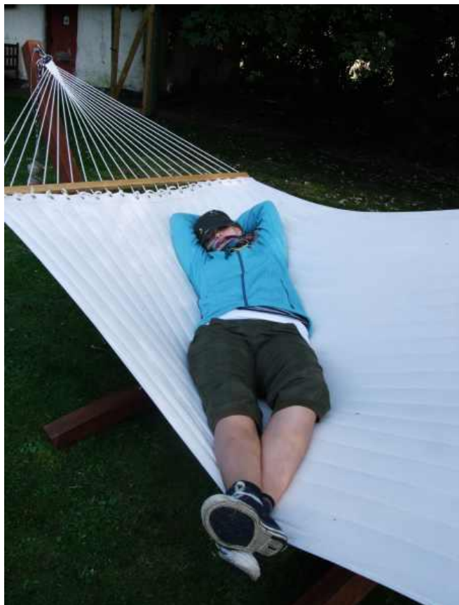
Afslapning (pub-crawl kan være trættende).

Vi startede med pokalkrolf baglæns på banen, og der skete de sædvanlige overraskelser og alligevel var der en af de tidligere mestre der kom frem til finalen.