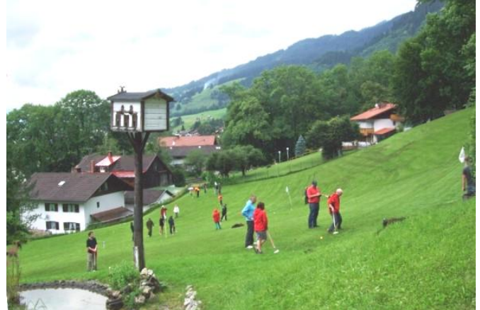
Det går noget op og ned i Bad Hindelang.

det ikke muligt at slå op til hullet i 1 slag, selv med golfslag eller bagvendere. Og så blev der spillet på en bjergside, så det var ingenlunde vandret, men heller ikke så skråt at kuglen hele tiden stak af. Jo - på hul 1 og 8 skete det en del gange, men det var en sjov og udfordrende bane, hvor runder på under 50 slag var godt.