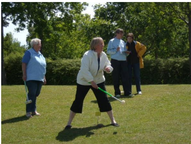
Der kæmpes på banerne.

Der var 3 baner og vi spillede 1 runde på hver bane, med en times frokost indlagt i midten. Halvdelen af spillerne blev startet i flere puljer på en gang på banerne, og når de havde spillet, var det den anden halvdel tur til at spille. Det koster lidt ekstra tid, men det spiller ikke nogen rolle, når man har tid nok.