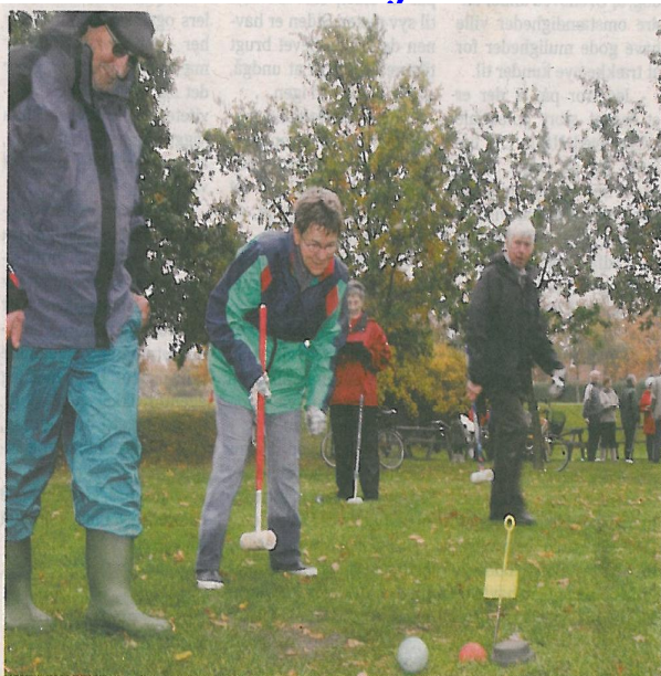
Krolfspillerne i Nysted tager på lørdag mod gæster fra blandt andet København til et åbent stævne.