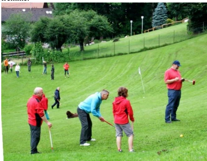
Vi sneg os til et spil med dansk udstyr, hvor jeg tangerede den uofficielle banerekord.

Der var i alt ca. 50 deltagere fra flere steder i Tyskland, Schweiz og så os fra Danmark, og efterhånden som resultaterne rygtedes, fornemmede vi at vi var med helt fremme.