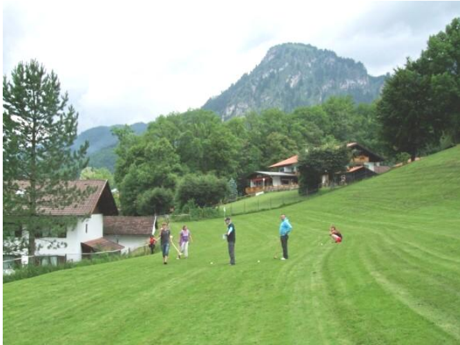
Der var bjerge til alle sider.