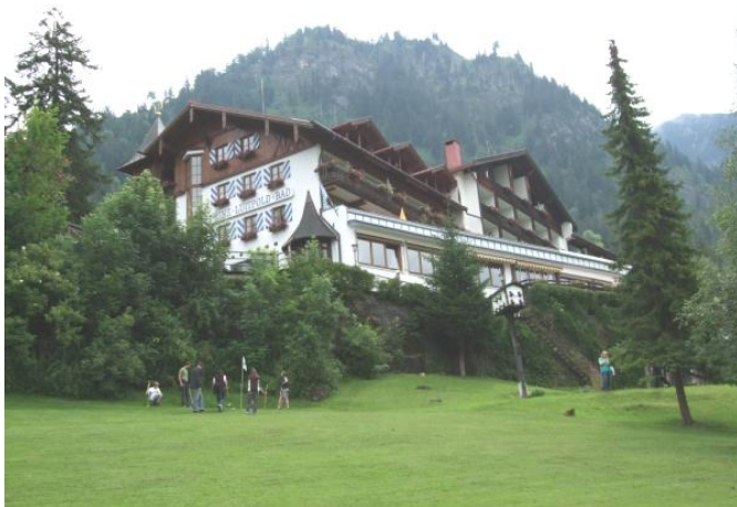
Hotel Prinz Luitpold Bad ligger helt fantastisk på en bjergside.

Reglerne er stort set som vores. Max. er ikke 8-skrive-10 slag, men 11-skrive-12 slag og når man lægger kuglen ind, er det en kølleskaftslængde og ikke et køllehoveds længde.