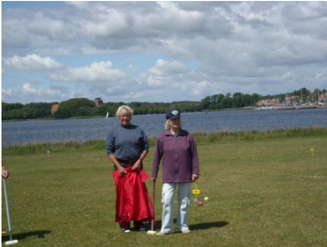
Der er en flot udsigt fra Nysernes bane.

Vallø hører under ældresagen og Vordingborg under DAI, men det er ret underordnet, da det jo bare drejer sig om at have en hyggelig dag, og det fik vi.