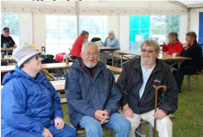
Der hygges i teltet.

Vallø hører under ældresagen og Vordingborg under DAI, men det er ret underordnet, da det jo bare drejer sig om at have en hyggelig dag, og det fik vi.