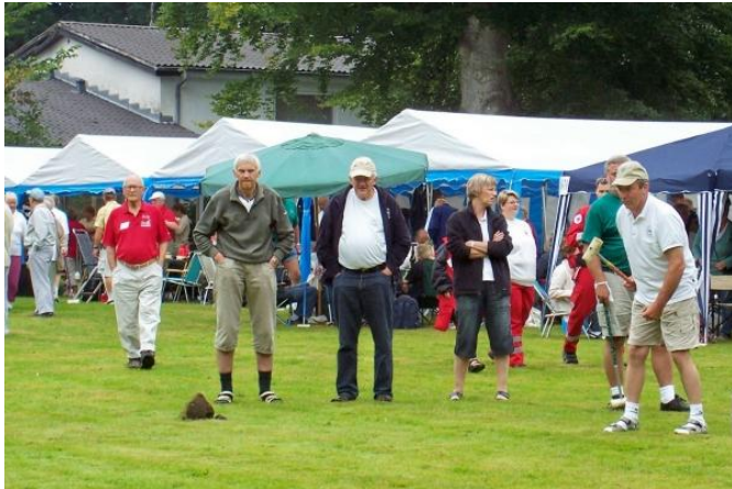
Få da de hænder op af lommerne - alle 4.

Lørdag spillede Tyskerne med og efter de 4 kampe kørte de til havet, som de jo ikke ser så tit, og så hjem igen søndag. Det er altså noget af en tur for at få tæv i krolf.