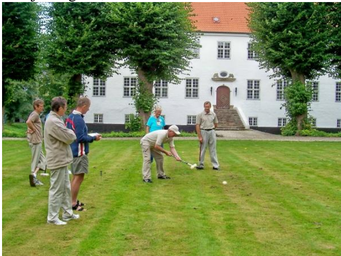
Spil i Riber Kjærgårds slotshave.