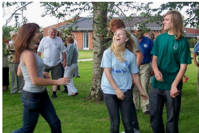
De unge stjerner har selvfølgelig ellevede fans.