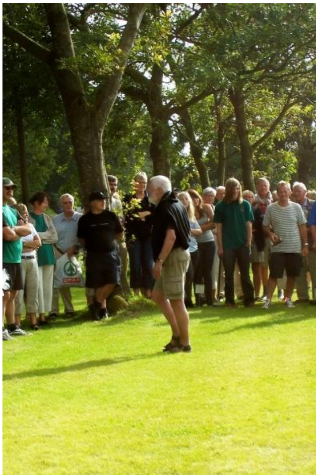
Frits synes at tilskuerringen skulle være større, så alle havde en chance for at se.