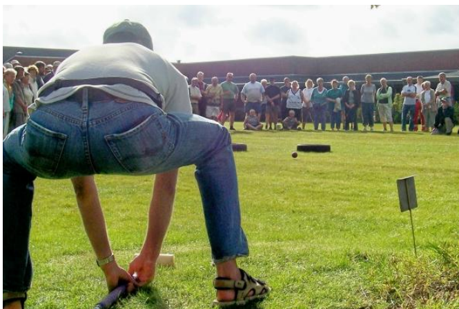
Uhada - går det mon godt?