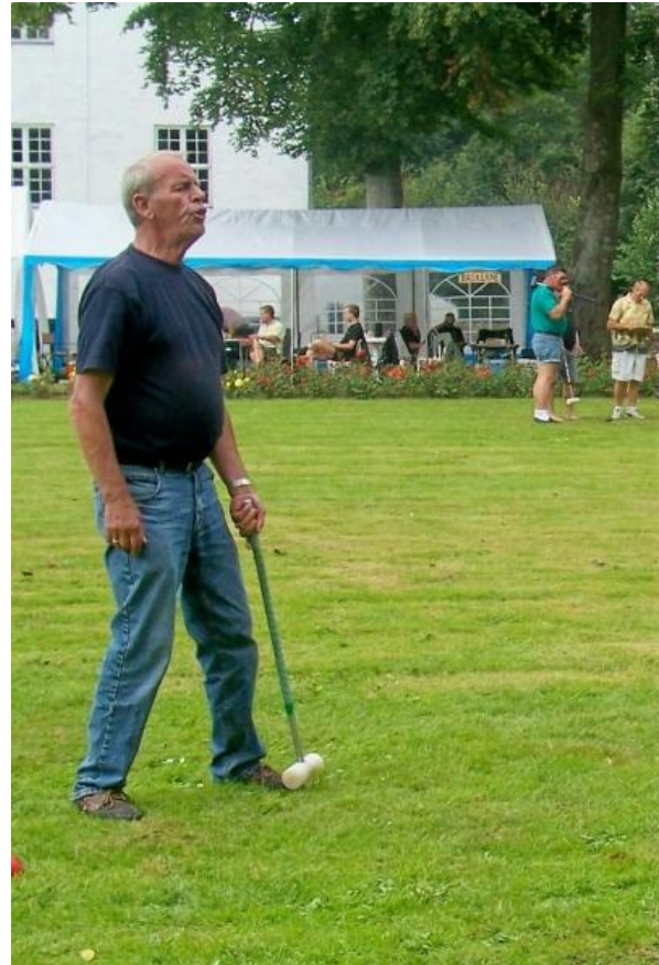
Sådan kan man se ud når det ikke går godt.

Vi kom lidt bagud fra starten, og var konstant 20-30 min. forsinket, hvilket var utrolig svært at indhente. Først da slagspillet var slut, snuppede vi lidt af pausen og kom på omgangshøjde med planen igen, så vi kunne passe spisetiden.