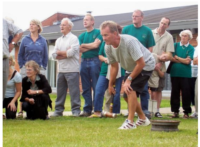
Mesteren viser hvad han kan, og folket ser måbende til.