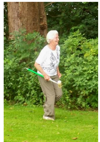
Men sådan ser man ud når det går rigtig godt.

Da vi ikke kunne være i 1 spisesal alle sammen, måtte vi desværre deles i 2. Det er ikke godt at overrække præmier når folket er delt, så vi valgte at gøre det direkte efter finalen. Det forhindrede ikke at en del folk ilede ind til bordet for at få de bedste pladser, og så kunne vi ellers stå der og forsøge at overrække præmier til nogen der sad inde ved bordet.