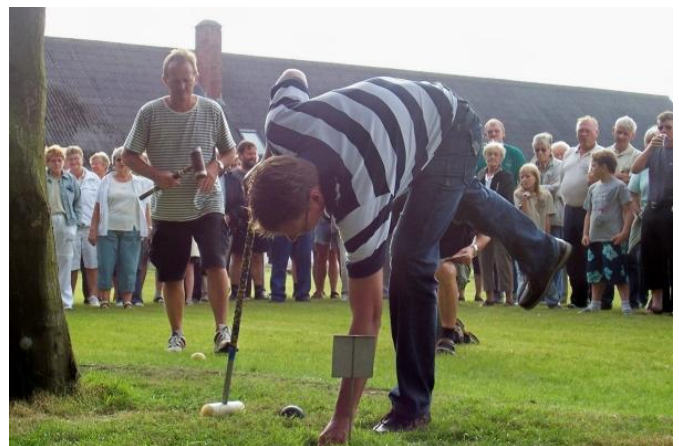
Nogle stod næsten på hovedet for krolf.