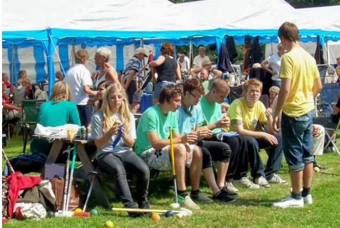
Drengene - og en enkelt pige - fra Humle Holdet satte kulør på stævnet.