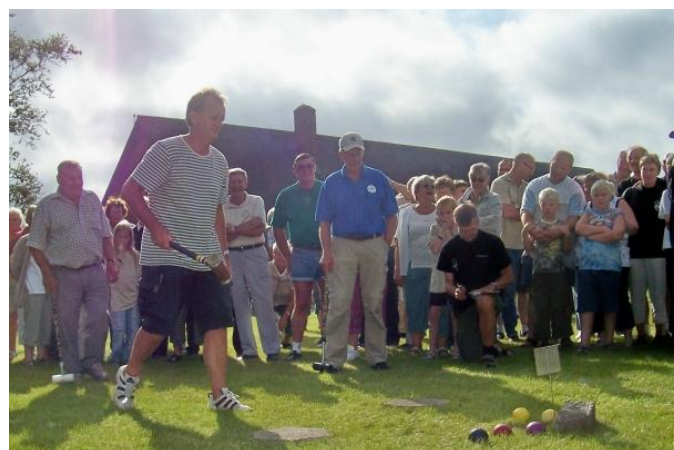
Jeg synes kuglerne klumper noget sammen.