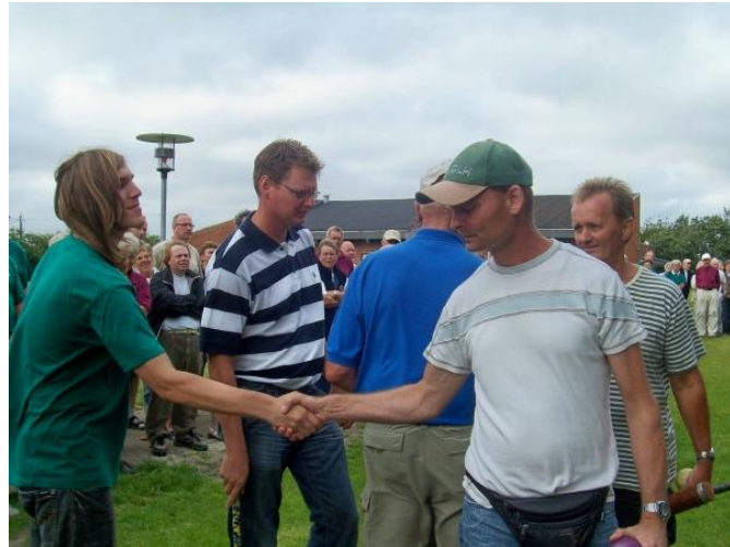
Tak for kampen.