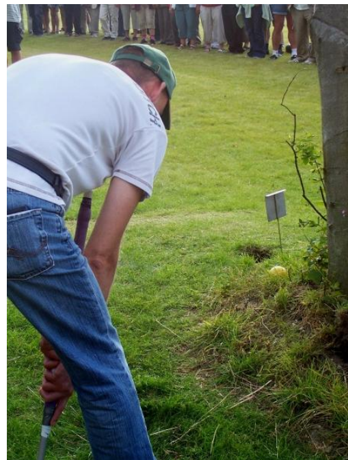
Hans i vanskeligheder.