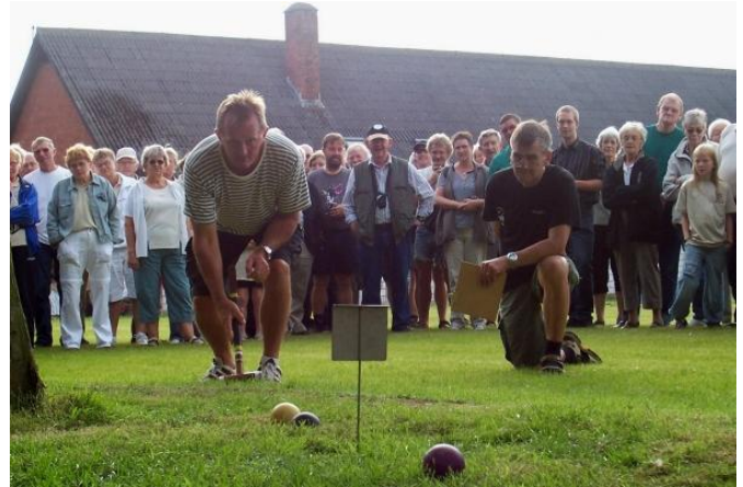
Nogle lå på knæ for krolfsporten.

Med disse dejlige ydre rammer samt strålende solskin og behagelige temperaturer hele dagen, var der lagt op til det største VM i krolf nogensinde. Der var 276 rigtige krolfspillere, men jeg havde også reserveret 2 pladser til samaritterne på spilleplanen. Der kom 3 samarittere, så de skiftedes til at spille, og efterfølgende har jeg spillet dem af planerne, så de har deltaget uden for konkurrence. Der var også 2 Tyskere på banerne. De kom fra Bad Hindelang næsten nede ved grænsen til Østrig. De tog fra Tyskland fredag, hvor de fløj til Hamburg, lejede en bil og kørte til Ribe hvor de overnattede.