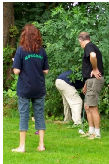
Nogle havde helt andre attituder.

DKU Ansvarshavende redaktør : Peter Christensen Grønforten 2, Ødis Kroge 6580 Vamdrup Homepage : www.krolf.dk Tlf. privat : 75 59 85 24 – mobil 29 93 91 17 Tlf. arbejde : 76 23 23 35 (YIT A/S) E-mail : Redaktionen@krolf.dk