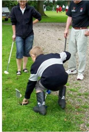
Leander i vanskeligheder, men sådan noget klarer de gode spillere i et snuptag.

Bortset fra at stævnelederen - vi nævner ingen navne - havde glemt 6 gavekort hjemme, gik også præmieoverrækkelsen som forventet, og vinderne - dem der var der - fik den fortjente hyldest.